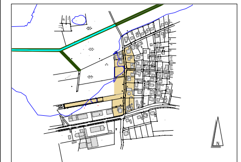
Übersicht Maßstab 1:5000